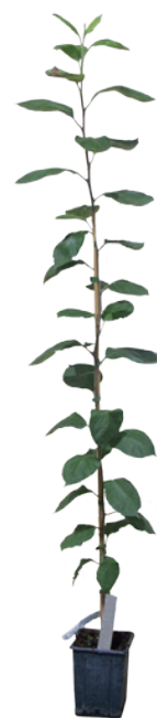
September: 1-jährige Veredlung